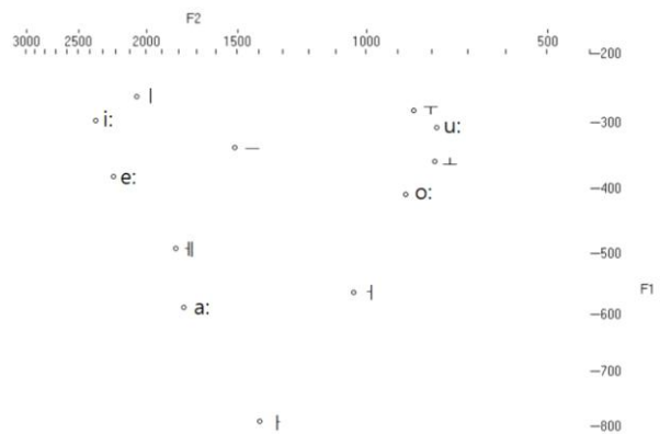
그림 2. 한국어와 이집트어의 모음 포먼트 도표 Figure 2. Formant plot of Korean and Egyptian Arabic vowels

그림 2를 보면 한국어의 /ㅏ/와 /ㅓ/는 이집트인 학습자들에게는 이집트어에는 없는 새로운 모음으로 지각될 가능성이 높아 보이는데, 대부분의 외국인 한국어 학습자들이 /ㅓ/를 /ㅓ/로 혼동하는 경향이 있어(Lee & Park, 2011; Meutia & Kim, 2012; Paek, 2010; Zhao, 2006) 이집트인 학습자들도 /ㅓ/를 /ㅓ/로 범주화할 가능성도 있다. 이집트어의 /a/는 포먼트 도표에서 한국어의 /ㅏ/보다는 /ㅓ/에 더 가까운데, 이집트인 학습자들이 한국어의 /ㅏ/와 /ㅓ/를 어떻게 범주화하는지 지각실험을 통해 살펴 보아야 한다. 그리고 한국어의 /ㅓ/와 /ㅗ/는 대부분의 외국인들에게 구별하기 어려운 모음이라서 지각에서 혼동이 발생할 것으로 예측되므로 이 점도 지각실험을 통해 검증해 보아야 한다. 한국어의 /ㅣ/는 이집트어의 /i/로 쉽게 범주화될 것으로 보이며, /ㅜ/는 이집트어의 /e/로 동화될 가능성이 높아 보이지만 음향적으로 이집트어의 /a/로 범주화되지는 않는지 지각실험을 통해 살펴볼 필요가 있다.